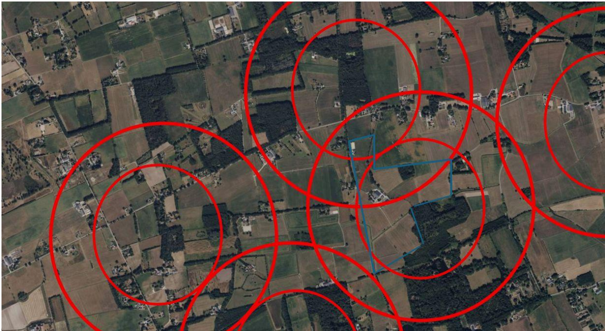
Figuur 1. Dassen territoria met hun globale 50 ha en 150 ha contouren ten opzichte van het plangebied.

in een deel van het jaar beschikbaar (i.t.t. regenwormen) en daarnaast is hun voedingswaarde aanmerkelijk minder (Schröder & Meijer, 2025).