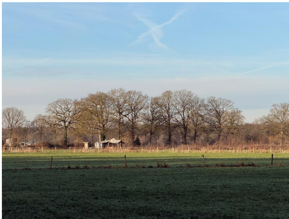
Landgoed Middenbos, foto genomen vanuit het plangebied op 17 januari 2026. Initiatiefnemer 1 heeft al een tent opgezet met wc en opslagcontainer. Het voedselbos is ook al in aanbouw. Nieuw is de fijnmazige afrastering om kaalvraat van het voedselbos te voorkomen. Dieren zijn dus niet welkom. Dit terrein hoort bij het foerageergebied van de dassen.

Veel leden van Natuurbehoud Tonden hebben zich aangemeld bij Berichten uit uw buurt (overheid.nl) om tijdig geïnformeerd te worden dat de vergunningsaanvraag van Haarweg 12 openbaar is gemaakt. Niemand heeft hiervan een melding gekregen, waardoor wij pas vlak voor kerst, heel toevallig, zagen dat de aanvraag al vanaf 15 december 2025 was gepubliceerd. Dit heeft ervoor gezorgd dat Natuurbehoud Tonden nog minder tijd heeft om de aanvraag met alle bijlagen (externe rapporten) goed te kunnen bestuderen. Een medewerker van de afdeling Ruimtelijke Ordening van Gemeente Brummen heeft op 16 december 2025 nog een e-mail gestuurd naar de voorzitter van Natuurbehoud Tonden over het plan Landgoed Middenbos en heeft toen niet vermeld dat de aanvraag gepubliceerd is. Wij vinden het missen van deze belangrijke processtap een kwalijke zaak.